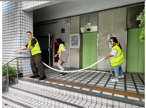
狀況：辦公室電力線路短路失火