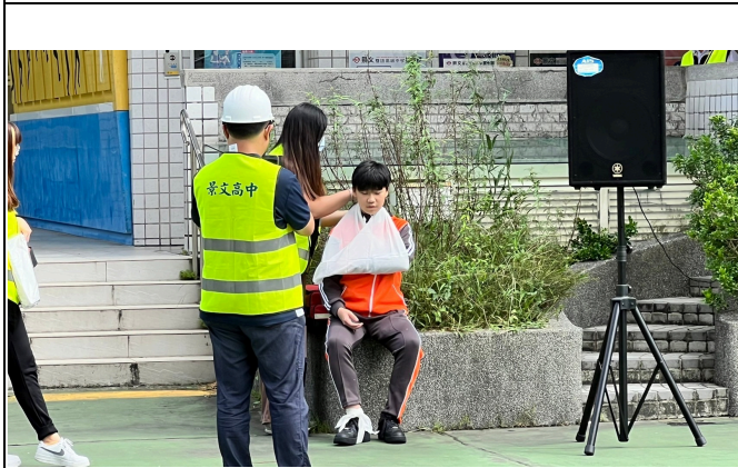
狀況：避難過程，跌倒受傷